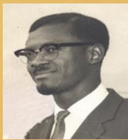
Eméry Patrice Lumumba