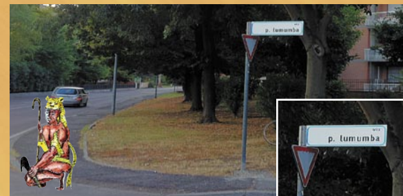
Posa di una yoga corona di fiori sulla via LUMUMBA

"Andare al di là di montagne, fiumi, foreste, valli, mari e oceani in cerca di uomini e donne etici che vogliono collaborare con l'Africa etica".