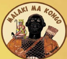
Ne Vunda Ambasciatore Kongo al Vaticano 1608