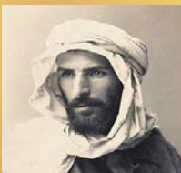
Pietro Savorgnan di Brazza